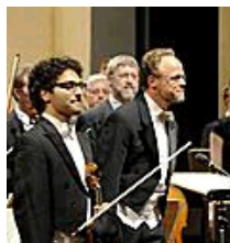
GMD Peter Kuhn bei einem Konzert mit den Bergischen Symphonikern.

Die Gutachter kommen in ihren Ausführungen zu dem Schluss, dass eine Fusion der Orchester die einzige ergiebige Möglichkeit sei, Geld im Kulturbereich einzusparen.